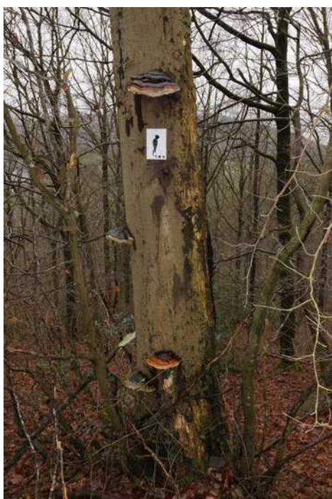
Le pic noir fréquente les talus de Coo