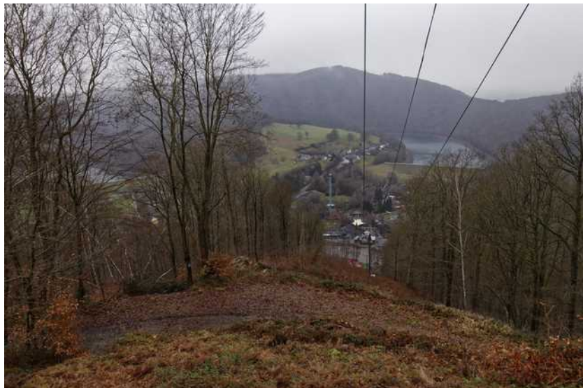
Arrivée au belvédère Thiry avec vue sur Plopsa-Coo et le lac inférieur de Coo.