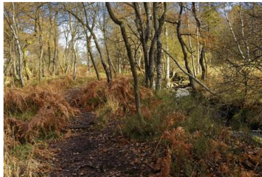
Le long du Trô Maret peu après le départ