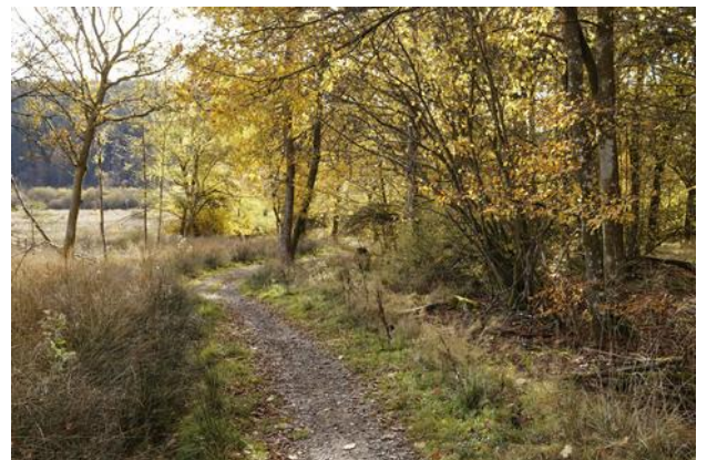
Arrivée au Chêne Frédéricq