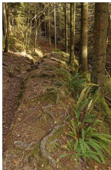
Descente vers le Trô Maret