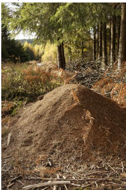
Nid de fourmis rousses