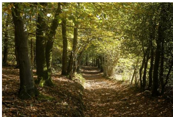
Près de Chèvrouheid