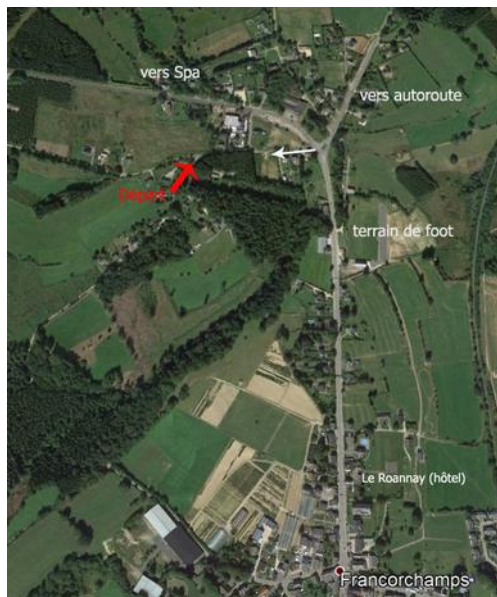
Montée vers Malchamps

Au départ des « Consoux » à Francorchamps nous montons par un sentier (1) vers la Fagne de Malchamps que nous traversons en suivant le caillebotis (2). Au bout de la fagne, nous bifurquons plein Sud vers Andrimont et passons non loin (3) du petit hameau de Chèvrouheid. De là par les chemin forestiers nous rejoignons le Roannay(4) que nous remontons jusqu'à notre point de départ.