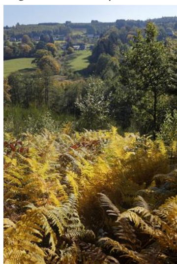
En descendant vers le Roannay