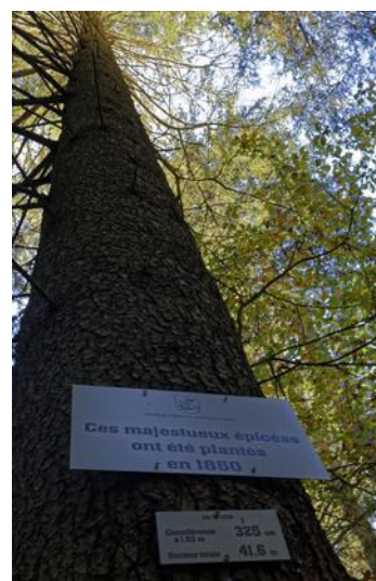
Vieux épicéas du Roannay