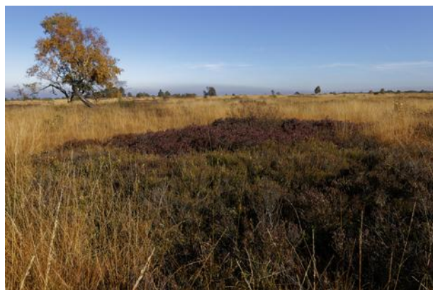
Fagne de Malchamps