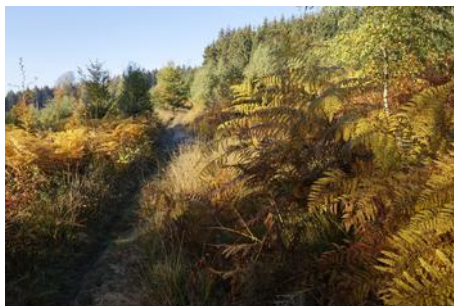
Caillebotis à Malchamps=>