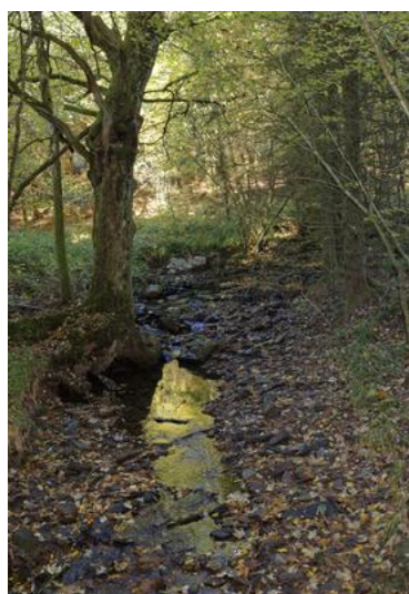
Dans le Roannay